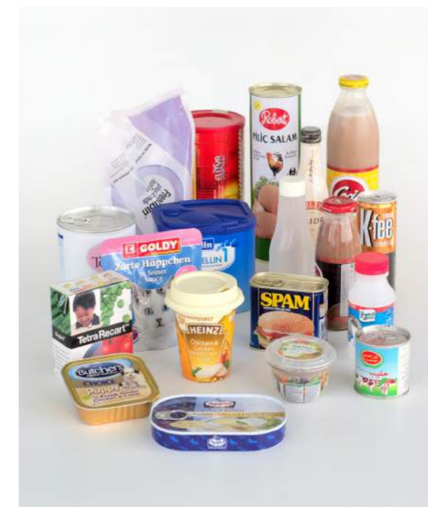
Alle Arten von Verpackungen – fordern Sie uns heraus!